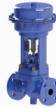
ECN - Modelo ECN 150 PSI

Válvula de controle tipo globo duas vias com acionamento pneumático, da linha econômica ECN, corpo em ferro fundido é utilizada para automação de processos simples, onde o serviço não é severo (vapor, água, etc.).