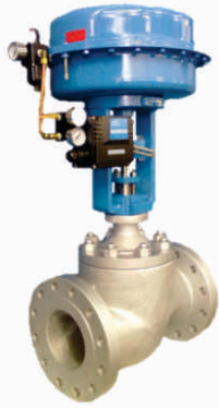
A20 - Modelo A20 150-600 PSI

Válvula de controle tipo globo duas vias flange solidário classe de pressão individual 150#, 300#, 600# ,com acionamento pneumático para engenharia de processos e aplicações industriais (vapor, água, gás, óleo, químicos, corrosivos, etc.).