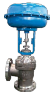
Globo angular de controle