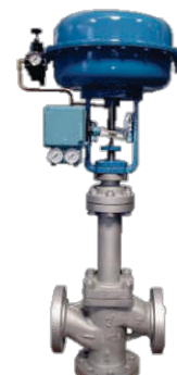
VC com fole de vedação