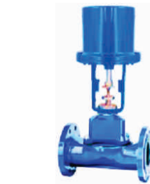
Diafragma de controle