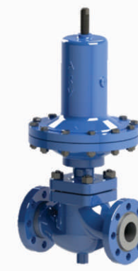
12 - R/AUTO OPERADA

Válvula tipo globo duas vias AUTO OPERADA, pode ser usada para redução de pressão ou alívio, é fornecida em diversas faixas de pressão para melhor atender ao processo com maior precisão e eficiência, tamanho de 1" a 6" 150#, 300# (vapor, água, gás, óleo, químicos, corrosivos, etc.).