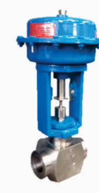
A30 - Modelo A30 150-600 PSI

Válvula de controle tipo globo miniatura, é utilizada onde se necessita de baixas vazões, pode ser confeccionada em vários tipos de materiais especiais (Hastelloy, Titânio, Monel, Inconel, etc.), (vapor, água, gás, óleo, químicos, corrosivos, etc.).