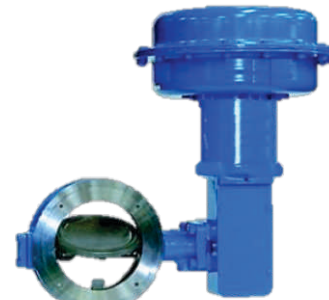
Borboleta de controle