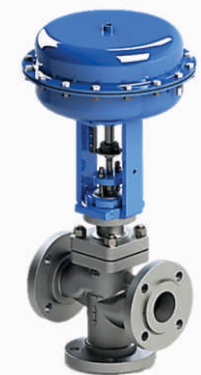
A40 Válvula de Controle Tipo Globo Três Vias

Válvula de controle tipo globo três vias flange solidário classe de pressão individual 150#, 300#, 600# ,com acionamento pneumático para engenharia de processos e aplicações industriais (vapor, água, gás, óleo, químicos, corrosivos, etc.).