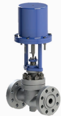
H20 Modelo H20 900-1500 PSI

Válvula de controle tipo globo com acionamento pneumático, para alta pressão duas vias flange solidário RF, RTJ, BW, SW,(muito utilizada em caldeira pesadas, Cogeração de energia), válvula para serviços severos, engenharia de processos e aplicações industriais (vapor, água, gás, óleo, químicos, corrosivos, etc.).