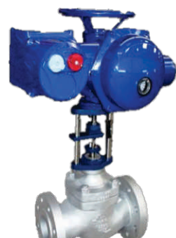
VC c/ atuador elétrico