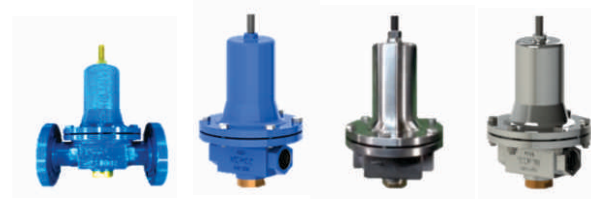
17 - AUTO OPERADA

Válvula de controle tipo globo três vias flange solidário classe de pressão individual 150#, 300#, 600# ,com acionamento pneumático para engenharia de processos e aplicações industriais (vapor, água, gás, óleo, químicos, corrosivos, etc.).