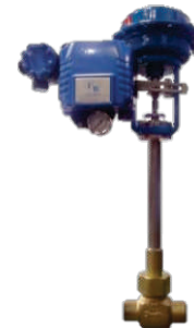
VG criogênica de controle