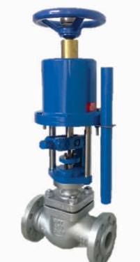
A19DF Caldeira 150-1500 PSI

Válvula Globo Descarga de fundo de Caldeira (VGDFC), alta performance contra trepidação no momento da abertura, longa vida útil, com volante e alavanca de abertura de emergência ótimo custo benefício, com atuador cilindro dupla ação retorno por mola classe de pressão 150#, 300#, 600#, 900#, 1500#.