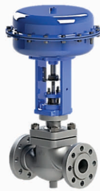
A10 - Modelo A10 150-600 PSI

Válvula de controle tipo globo duas vias com acionamento pneumático e flange solto, a mesma válvula pode ser utilizada de 150#, 300#, 600# apenas trocando as flanges, utilizada para engenharia de processos e aplicações industriais (vapor, água, gás, óleo, químicos, corrosivos, etc.) Fornecida em WCB, WCC, CF8M, CF3M, CF8, CF3, entre outros a consultar.