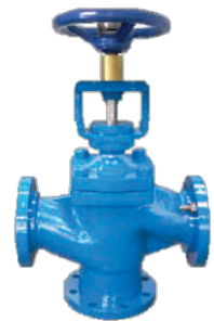
Válvula globo Manual especial